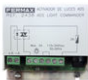
F02438 ACTIVADOR LUCES-TIMBRE VDS