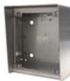
F04645 CAJA SUPERFICIE MARINE ST1