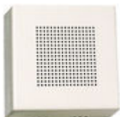
F02040 PROLONGADOR LLAMADA TELEFONO