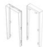
F04701 VISERA MARINE ST1