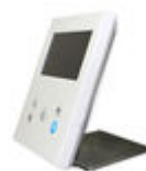
F09420 SOPORTE SOBREMESA MONITOR VEO- XS/VEO-XL