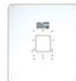
F03389 MARCO UNIVERSAL LARGE