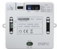
F09444 INTERFAZ CAMARA DUOX PLUS