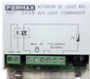
F02438 ACTIVADOR LUCES-TIMBRE VDS