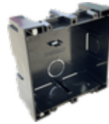
F08948 CAJA EMPOTRAR CITY KIT S1