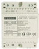
F04802 ALIMENTADOR DIN4 230VAC/12VAC-1A