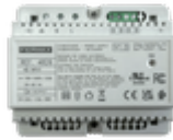
F04826 ALIMENTADOR+FILTRO DIN6 24VDC-1.5A