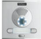
F40008 PLACA CITY S1 CP201 DUOX PLUS