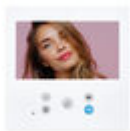
F09469 MONITOR VEO-XL WIFI 7" DUOX PLUS