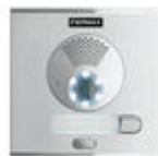
F40708 PLACA CITY S1 CP101 DUOX PLUS