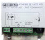
F02438 ACTIVADOR LUCES-TIMBRE VDS