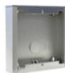
F07061 CAJA SUPERFICIE CITY S1