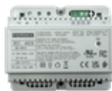
F04826 ALIMENTADOR+FILTRO DIN6 24VDC-1.5A