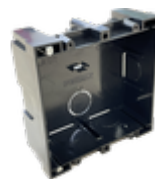
F08948 CAJA EMPOTRAR CITY KIT S1