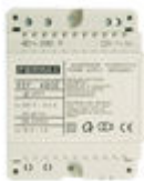
F04802 ALIMENTADOR DIN4 230VAC/12VAC-1A