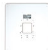
F03389 MARCO UNIVERSAL LARGE