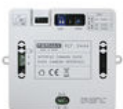
F09444 INTERFAZ CAMARA DUOX PLUS