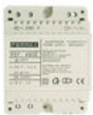
F04802 ALIMENTADOR DIN4 230VAC/12VAC-1A