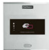
F06992 LECTOR PROXIMIDAD CITY