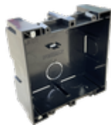
F08948 CAJA EMPOTRAR CITY KIT S1